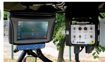
Boîtier de commande : Simple d'utilisation et robuste