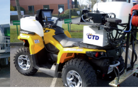
CHEMINS DE FER